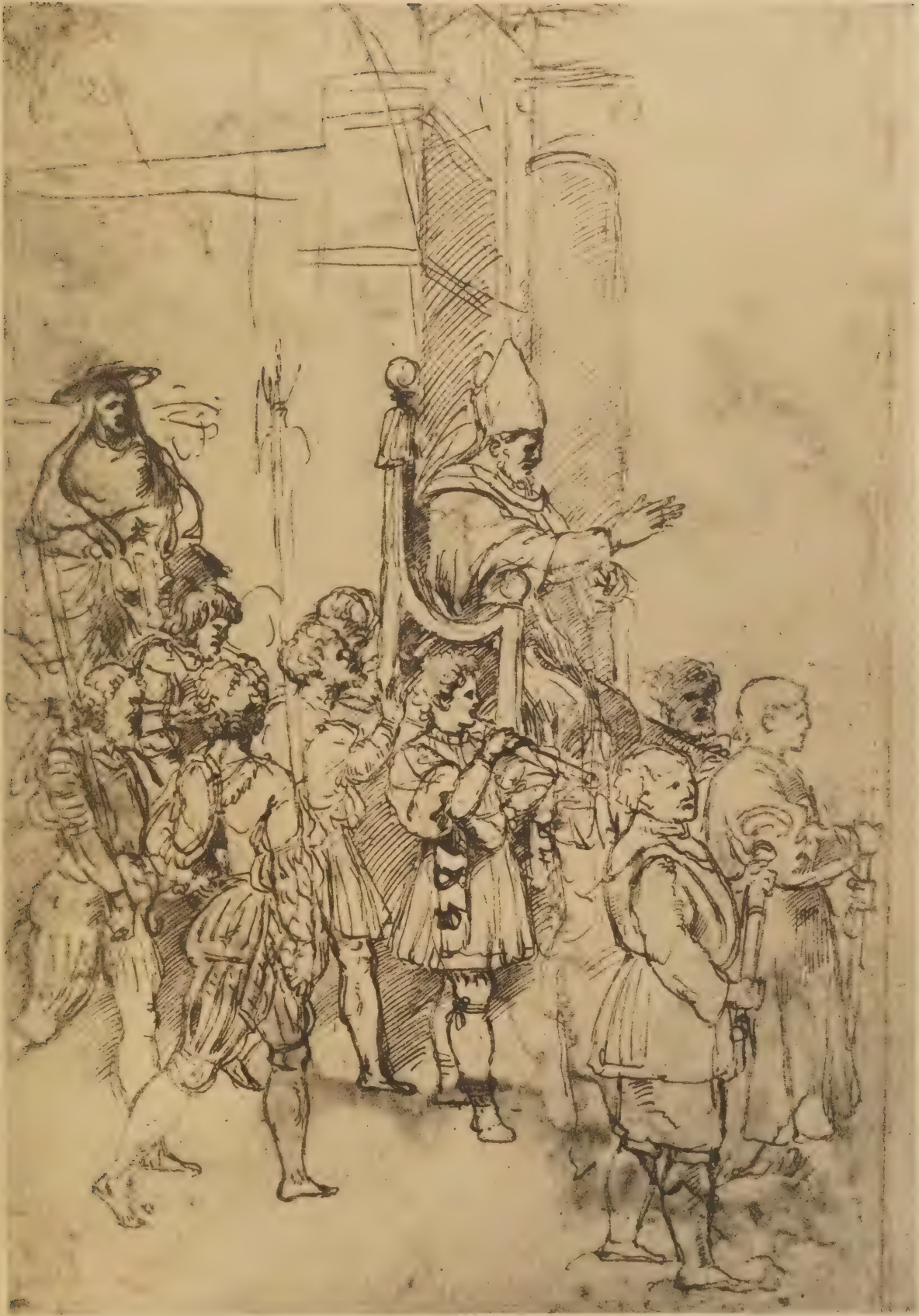
Etude représentant le Pape pour la fresque de l'Elidore